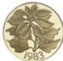
Flor de Navidad (Poinsettia)

Monedas de 100 Balboas de 1978, 1979 y 1980 en oro ley .900, con un diámetro de 26.16 mm