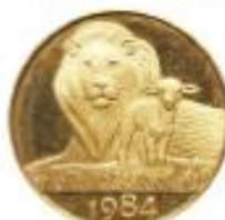
El León y el cordero