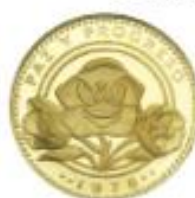
Flor del Espíritu Santo

Monedas de 100 Balboas de 1978, 1979 y 1980 en oro ley .900, con un diámetro de 26.16 mm