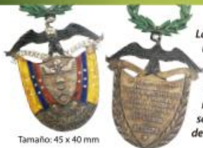
Tamaño: 45 x 40 mm

La historia temprana de Panamá ha estado muy ligada a la historia de nuestro Canal Interoceánico, por ende no es inesperado que la primera medalla del Canal de Panamá, sea también la primera medalla de Panamá.