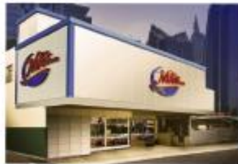
VÍA ESPAÑA 223-0111