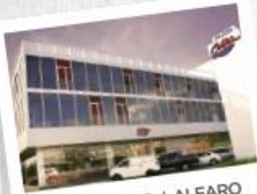
VÍA RICARDO J. ALFARO 302-0453