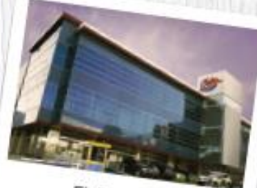
EL DORADO 305-3551