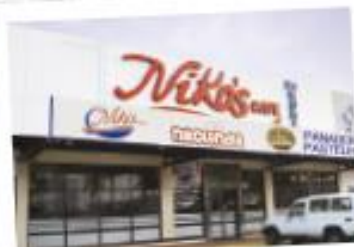
LOS PUEBLOS 217-7775