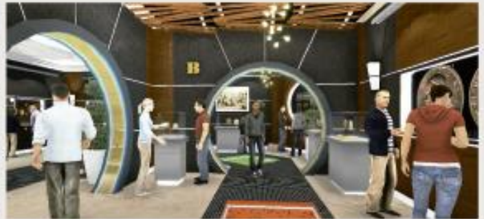
Detalle del Recinto Numismático. Los espacios interiores serán ordenados y ambientados de manera que los visitantes puedan apreciar la impresionante y completa colección numismática que pertenece a todo los panameños y que ostentamos orgullosamente el Banco Nacional de Panamá como un patrimonio inalienable de la nación. Para los amantes de esta afición, el Recinto Numismático contará con una tienda así como una proyección multimedia, donde se presentarán videos y se realizarán exposiciones de temas de interés para los coleccionistas y el público en general. También se ofrecerá en venta una gran variedad de monedas conmemorativas con valor numismático.

El Banco Nacional de Panamá inició el proyecto para la construcción de una moderna infraestructura para exhibición y venta numismática y una agencia bancaria en el Casco Antiguo de la ciudad capital.