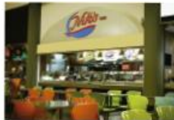
SUPERCENTRO EL DORADO