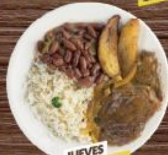
JUEVES BISTEC DE RES