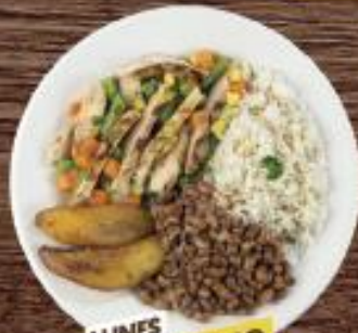
LUNES FAJITAS DE POLLO