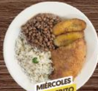
MIÉRCOLES POLLO FRITO