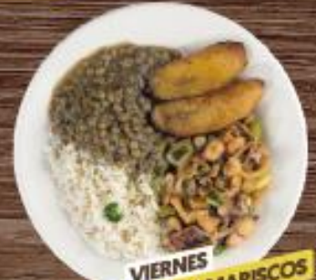
VIERNES CHUPÉ DE MARISCOS